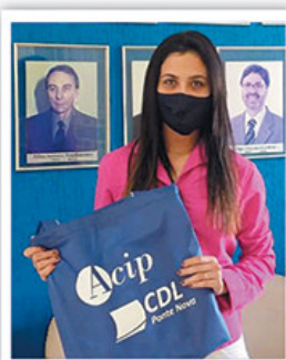
Insight Consultoria de Psicologia