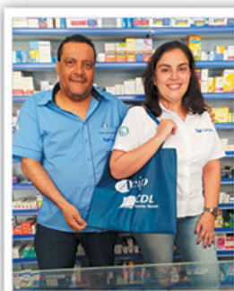
Droga Hera (Centro)