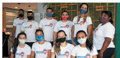
Vida Leve Academia