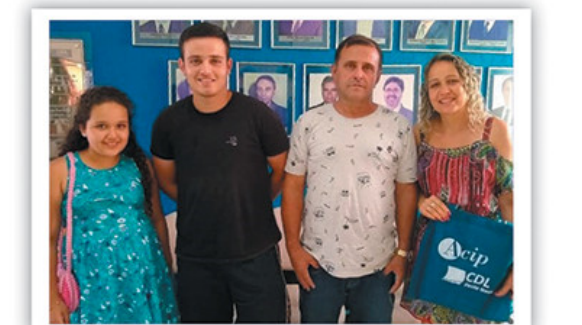
Loja A (Jequeri)