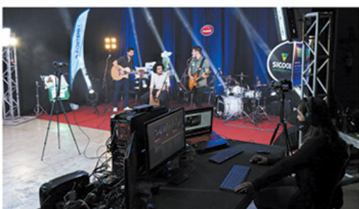
Bastidores de uma das lives do festival

A inovadora ideia foi elogiada por muitas pessoas, pois foi uma forma de valorizar não somente os bares, mas também os profissionais envolvidos, especialmente os que trabalham com eventos, como músicos, profissionais de som, luz, palco, iluminação, decoração, entre outros. Estas pessoas foram duramente atingidas pela pandemia e o BBC 2020 veio para ajudá-los neste momento difícil.