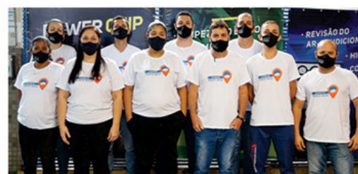
Escapamentos São Geraldo