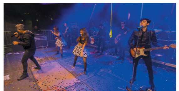
Banda All Star, encerrando a Saideira do BBC 2019