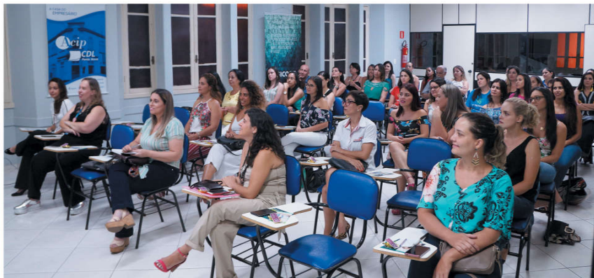
Dezenas de representantes de empresas associadas participaram do encontro

Com o objetivo de valorizar a importância da mulher brasileira, seu talento empreendedor e seus desafios frente ao mercado de trabalho, aconteceu no dia 8 de março a 6ª edição do “Empreendedoras de Sucesso”. O evento, com vagas gratuitas e limitadas, aconteceu na Sala de Treinamento da ACIP e teve cerca de 40 participantes. A realização foi da