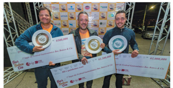
Os vencedores do BBC 2019 (a partir da esquerda): Espaço Caffé (3º lugar), Japa Sombrero (1º lugar) e Cantina Sabor de Roma (2º lugar)

O Bar, Boteco & Cia 2019 foi realizado de 7 de junho a 13 de julho. Durante este período, 11 estabelecimentos receberam milhares de consumidores experimentando seus pratos. Nesta edição, participaram do festival: Benemérito, Cantina Sabor de Roma, Espaço Caffé, Gol de Placa, Japa Nobre, Japa Sombrero, Mistura Fina, Moenda, Ponte Nova Grill, Tio Patinhas e Zero Grau. Fizeram parte dos pratos desta edição: carne suína, requeijão e mandioca. Os bares, botecos e restaurantes foram avaliados pelos consumidores e jurados nos seguintes quesitos: prato, apresentação do prato, atendimento e higiene.