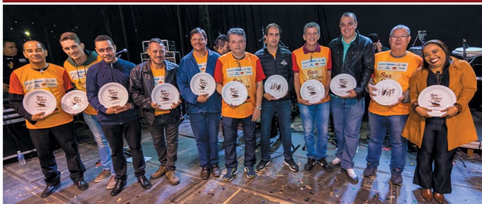
Homenagem aos representantes dos 11 estabelecimentos participantes