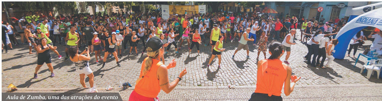
Aula de Zumba, uma das atrações do evento

Houve ainda a premiação em dinheiro por equipes e por categorias (divididas por idades). A classificação completa está em nosso site: www.acipcdl.com.br .