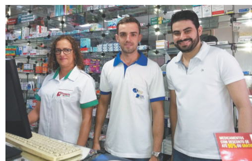
Drogaria do Povo