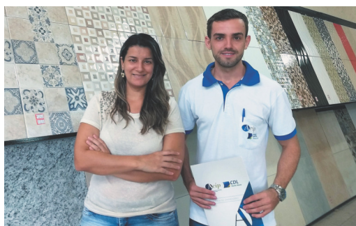
Estação Pisos e Revestimentos