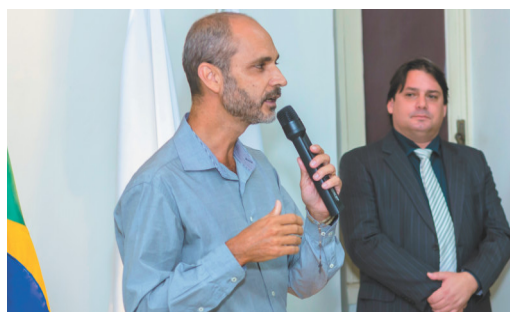
O prefeito de Ponte Nova, Wagner Mol, em seu discurso durante a solenidade