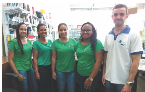
A Rural Madeiras

Para facilitar ainda mais, a ACIP/CDL criou um Manual de Suporte aos associados, envolvendo os seguintes temas do SPC: cadastro, crédito e cobrança. Esta ferramenta servirá para orientar os colaboradores das empresas. Os associados interessados podem solicitar este manual pelo e-mail: acipcdl@gmail.com .