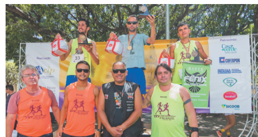
Geral Masculino - Ponte Nova