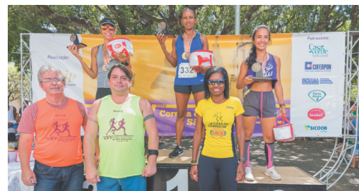
Geral Feminino - Ponte Nova