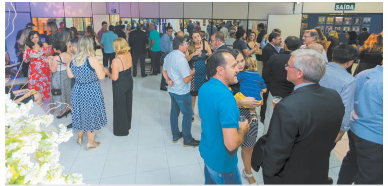
A solenidade aconteceu na sede da ACIP/CDL