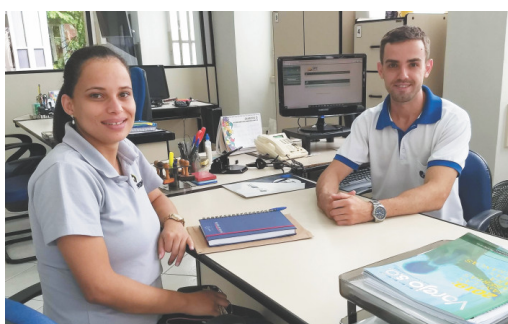
Supremo Artefatos e Pré Fabricados de Concreto