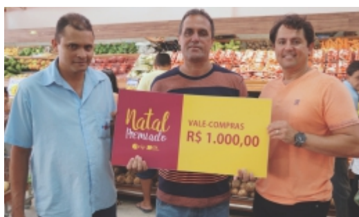
Reinaldo Fabri Supermercados Poupy