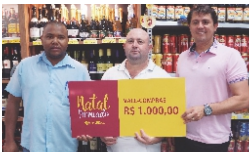
Eduardo de Souza Toledo Supermercados Poupy