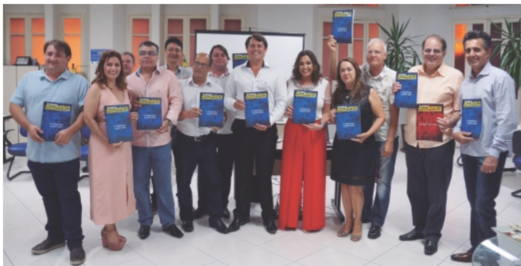
Diretores da ACIP/CDL presentes no lançamento da revista

No dia 12 de janeiro, a ACIP/CDL realizou a solenidade de lançamento da segunda edição da revista “Ponte Nova Acontece – A cidade que a gente ama”. O evento marcou o início do cronograma de atividades da ACIP em comemoração aos 80 anos da entidade, que serão completados no próximo mês de abril.