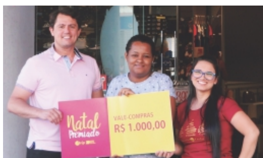
Thaís de F. Viana Mundial Center