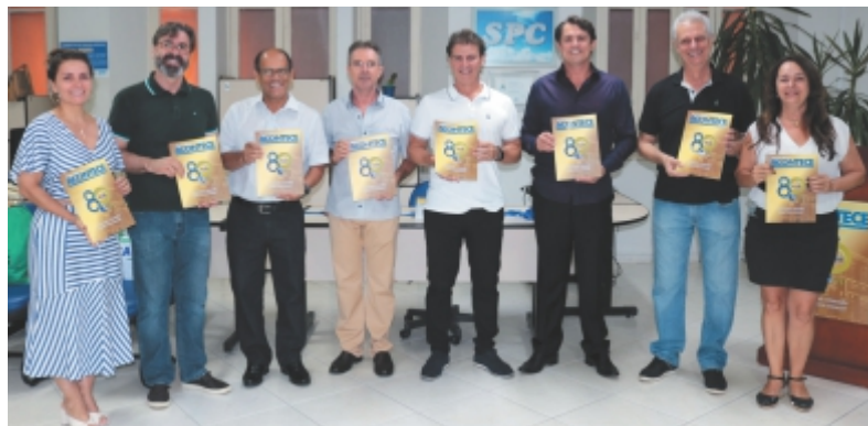
Diretores da ACIP/CDL presentes no lançamento da revista

A tiragem é de 4 mil exemplares, com distribuição gratuita. Todos os associados e anunciantes irão receber um exemplar da publicação. A ACIP/CDL irá fazer também uma distribuição em pontos estratégicos da cidade. Quem quiser pode também retirar um exemplar, de forma gratuita, na sede da entidade. Acesse nosso site e leia a versão digital da revista: www.acipcdl.com.br