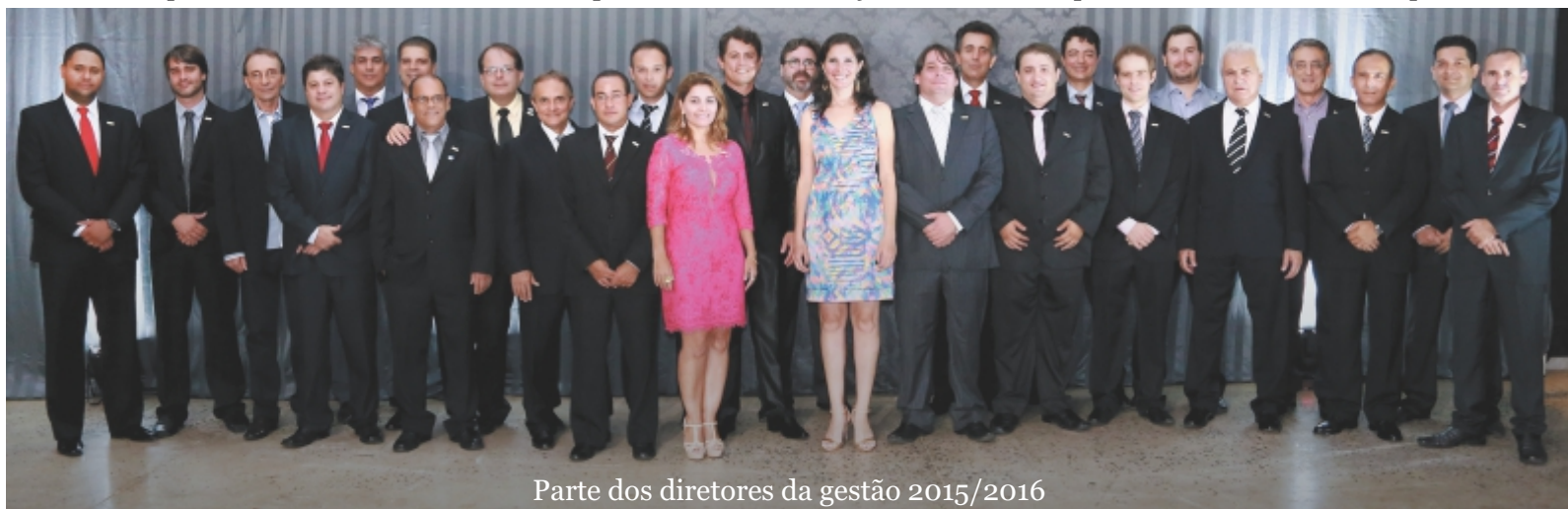
Parte dos diretores da gestão 2015/2016

questão de focar em pautas nas esferas política e social. Entre elas, podemos destacar a revitalização do Hotel Glória, o fortalecimento do Centro Histórico, a participação no projeto de Mobilidade Urbana do município e o combate às feiras itinerantes.