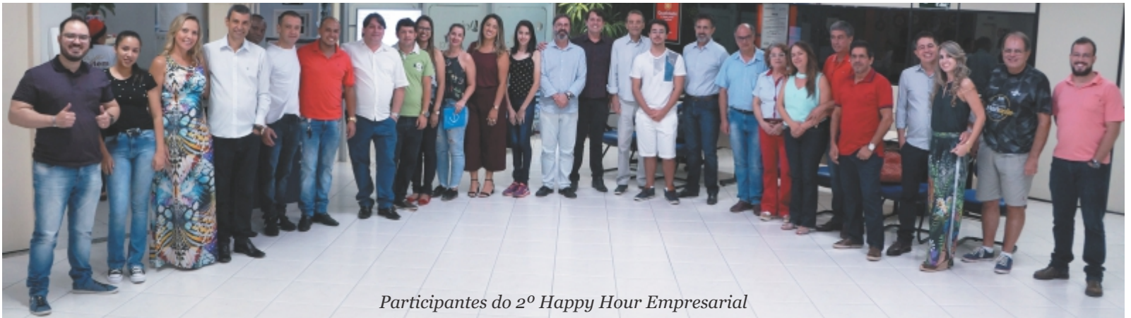
Participantes do 2º Happy Hour Empresarial

Apache Imóveis, BCM Advocacia, Beira Rio Tintas, Cia da Moda, Depósito de Fumo São João, Folha de Ponte Nova, GF Soluções Educação Corporativa, GGBC, HML Agropecuária, Pegadas Calçados, Pontal Engenharia, Posto Pacheco, Posto Pracinha, Rádio Ponte Nova e Sonho de Mãe.