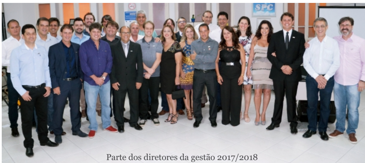
Parte dos diretores da gestão 2017/2018

Veja nas próximas páginas algumas fotos dos principais eventos e ações realizados na gestão 2015/2018.