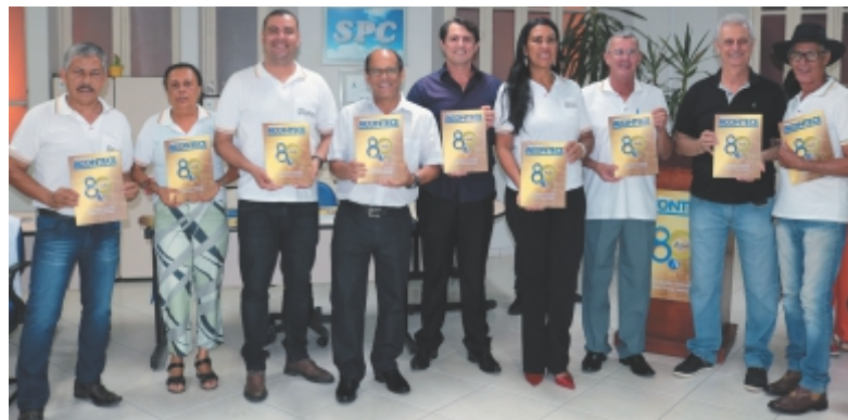
Vereadores e diretores da ACIP/CDL