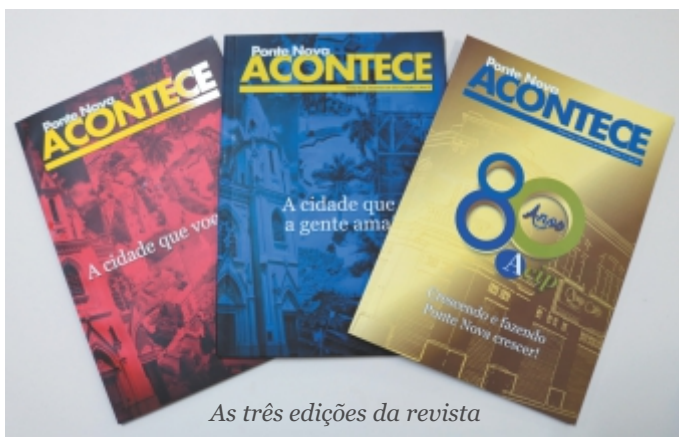
As três edições da revista

No dia 20 de dezembro, a ACIP/CDL realizou uma solenidade de lançamento da terceira edição da revista “Ponte Nova Acontece”. Diversos empresários associados, diretores, patrocinadores e entrevistados estiveram no evento.