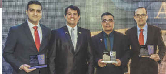
Homenagem às empresas parceiras do evento: Laticínios Porto Alegre, Saudali e Sicoob