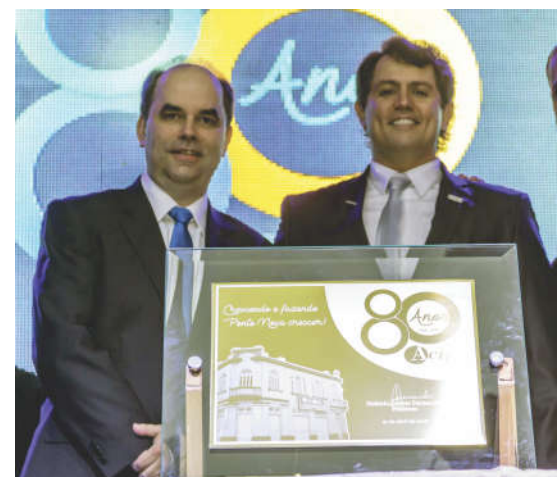
Descerramento da placa comemorativa dos 80