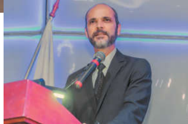
Wagner Mol Prefeito de Ponte Nova