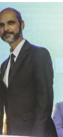
80 anos da entidade